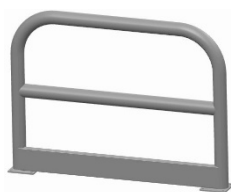
BARIERKA TYP 3