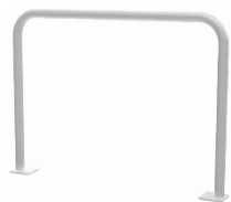
BARIERKA TYP 1